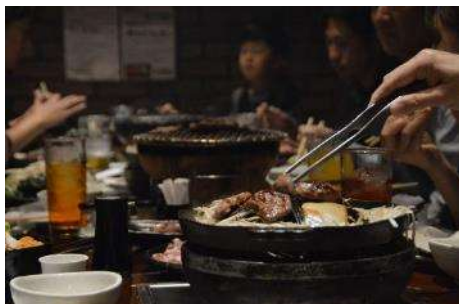
▲ジンギスカン、好評でした