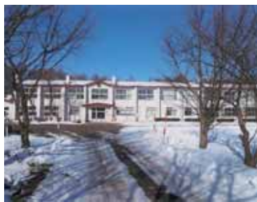
計根別中学校の校舎

このような現状に鑑み、児童生徒の減少が予測されることから、昨年10月策定の「中標津町立小学校の適正規模に関する基本方針」に基づき、小規模校の統廃合も視野に入れながらPTAや地域の方々と十分協議し平成23年度スタートの「第六期中標津町総合発展計画」の実施計画の中で、できるだけ早い時期の改築に向け十分検討し、教育環境の整備に努めてまいります。