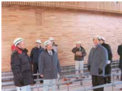
東小屋内運動場視察状況

繰上償還の財源として低利な民間資金を充てることから、全体で3億304万円の利子軽減が見込まれ経営の健全化に寄与することになります。