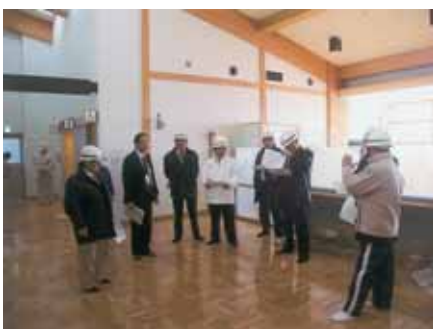
空港内部視察状況

2月1日に一部供用開始になった1階の荷物受け取り所と到着ロビー、2階の売店とレストラン部分を視察しました。