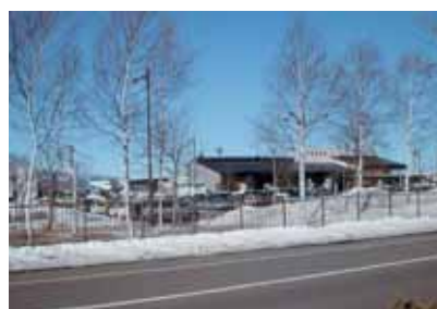
根室・中標津空港

連絡調整会議的なものを正式に設置はいたしません。より多くの方々より貴重なご意見を拝聴する機会を増やすべく努力をしてまいります。