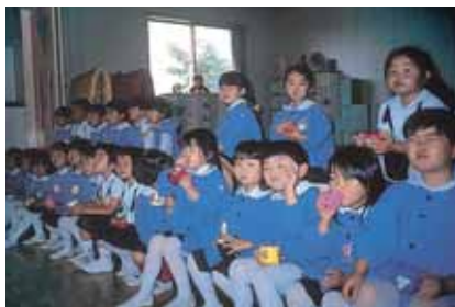
虫歯のない白い歯に

を学校歯科医、学校保健担当者及び教育委員会で立ち上げ、協議会での意見を参考にスムーズに効果的な実施に向けて取り組みたい。