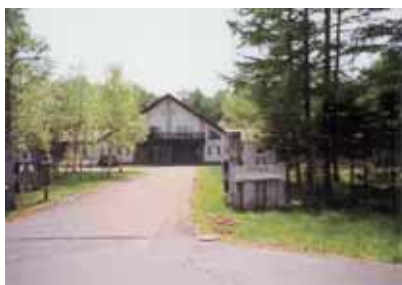
畜産食品加工研修センター

新しい価値が生まれるのに合わせて創り出される加工食品については、特許や商標登録の可能性なども期待でき、今後畜産食品加工研修センターや農業高校、農協と連携を図りながら積極的に進めてまいりたいと考えております。