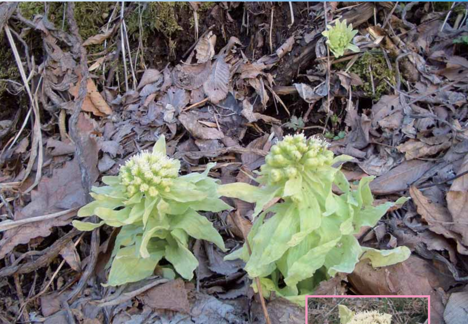
春への一歩…顔を出したフキノトウ