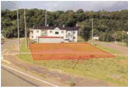
売払い済み土地（西町）

なお、町の平成18年度決算額による試算では企業会計も含め、いずれの指標も基準をクリアしていません。