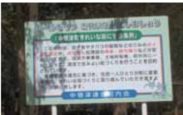
公園に設置された条例の看板

12月末での入院・外来患者数は、前年同期に比べ減少しています。入院・外来の診療収入は、若干の減少であることが報告されました。また2月からの外来診療体制についても報告されました。