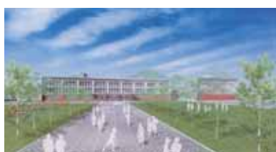
懸案だった東小学校の改築