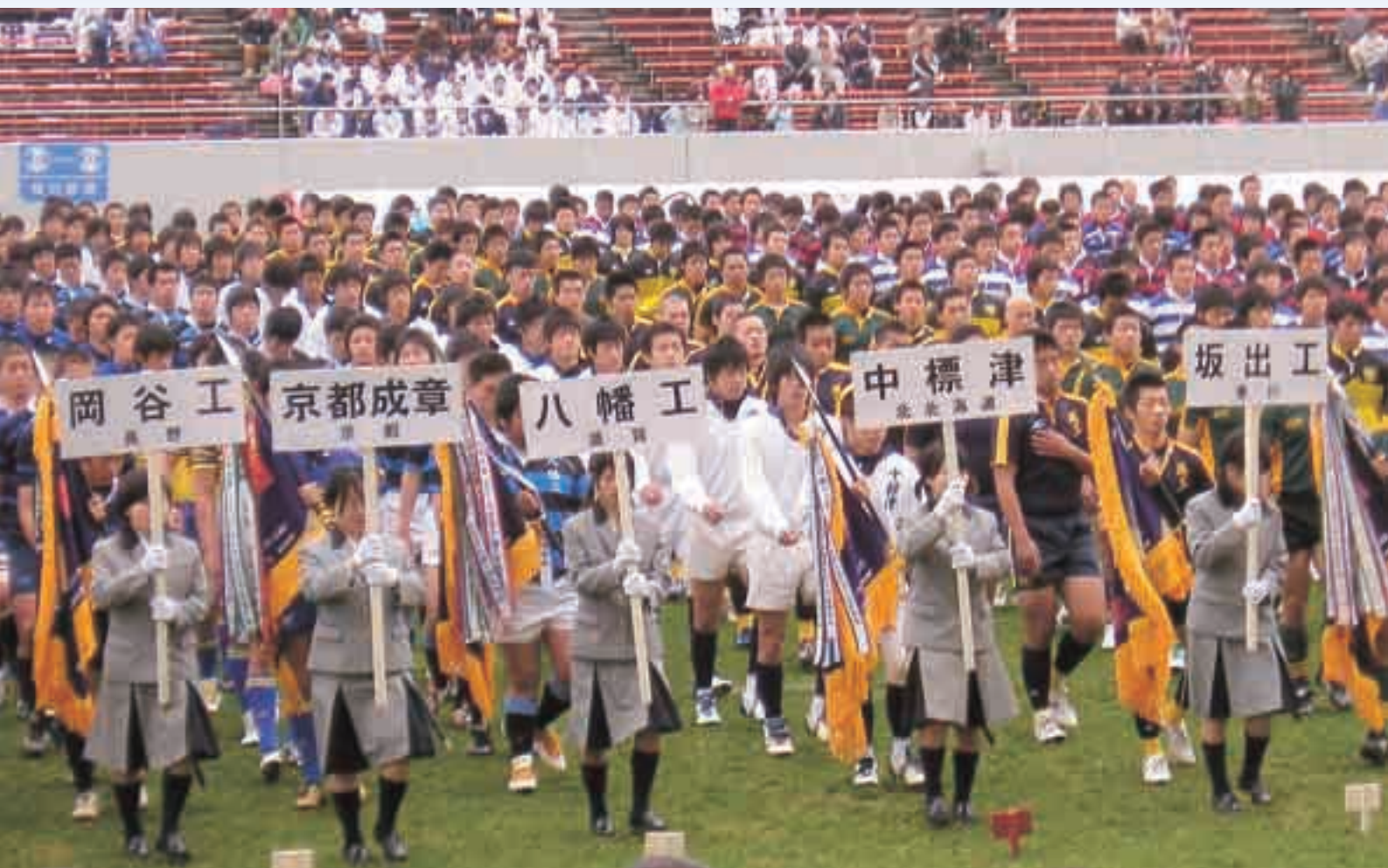
第86回全国高校ラグビー大会で入場行進するN高ラグーマン