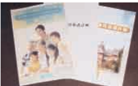
国民保護計画を周知するパンフレット

「事態等」が発生した場合においては、議員の自発的な活動を制限することはなく、「事態後」におきましては、しっかりと町が検証を行い、国民保護協議会を開催し意見を頂き、所管する