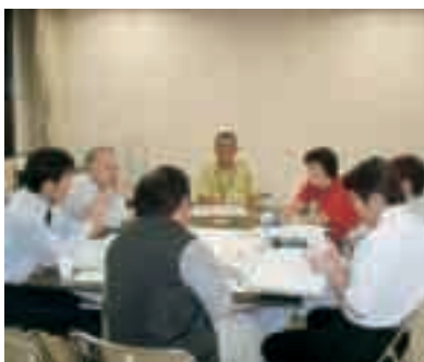
行政と町民が共に考える町民会議

取り組み状況は、役場のまちづくり情報コーナー、総合文化会館、計根別支所で閲覧できます。