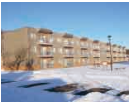
住宅マスタープラン策定の中で検討

住宅困窮者のために必要最小限の住宅を確保しておくという点では、現在の応募状況や長期間の空住宅が発生することなどを考えると難しいが、入居選考において優先的に取り扱うなど対応していきたい。