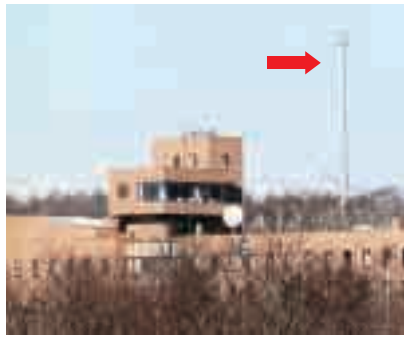
町内27カ所に設置されている電波塔

町の関係した観光マップの郊外部分が、イラスト化が過ぎてチーズや牛乳を製造している農