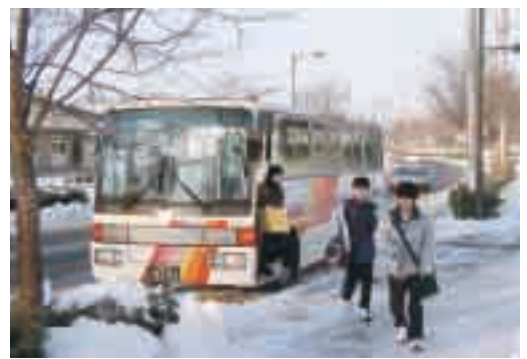
規制緩和でスクールバスの利用も可能に

平成12年に創設された公営住宅ストック総合改善事業によれば自治体が活用計画を決めると、国庫補助が受けられる仕組みになっているが、基本計画策定の