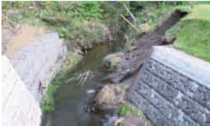
暴風雨で法面が決壊した町内の河川