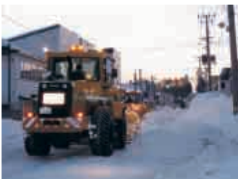
経費削減のため除雪作業に協力を

所有者等の調査確認をし、冬道の安全確保上、特に支障がある立木は伐採することが可能であれば対応します。