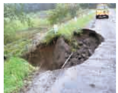
豪雨で流失した町道法面

施設で2件、民家の住宅被害12件、町立保育所など公共施設の雨漏り20件、他に道路、河川の法面決壊、土砂流失被害など合わせて公共施設被害額1530万円となり、推定被害総額1億2438万円に達する被害を受けました。