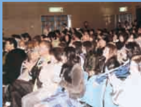
しるべつとで応援する町民