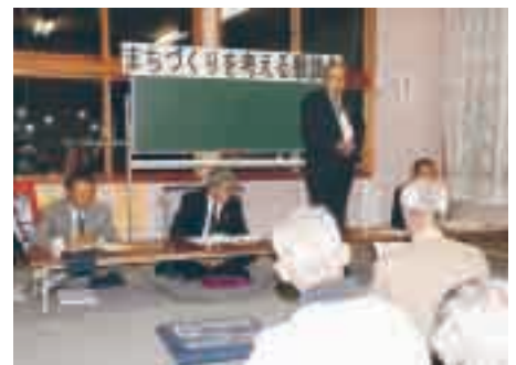
次年度にむけ開催方法の検討がされる懇談会