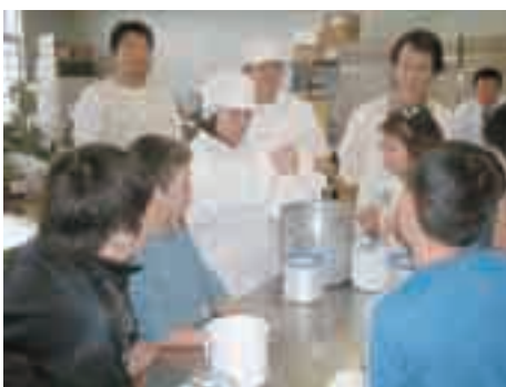
小学生と食農教育での交流

とあわせて農高と地域関係機関の連携を図り、本町の実情を踏まえて魅力ある農高の充実に努めて参ります。