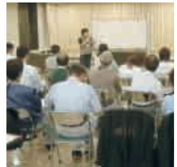
パートナーシップで進めるまちづくり町民会議

今後、町民組織・議会より自治基本条例制定の機運があった場合、取り組むべきと思います。