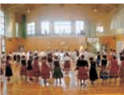
計根別芸術文化祭 フォークダンス発表会