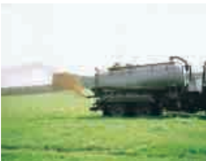
良質な土づくりに欠かせないスラリー散布

次に有機牛乳でブランド化とありますが、経費、作業負担など一朝一夕にできるものではないと聞いておりますのでご理解を願います。