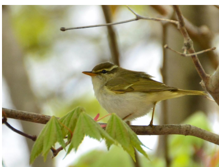
センダイムシクイ