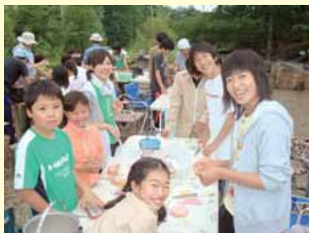
武佐でのキャンプ