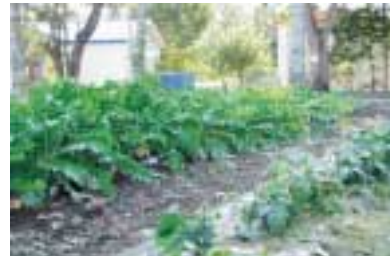
9月26日計根別児童館菜園

7月のバス研修の会場となった計根別児童館の野菜の成長を追ってみました。今年の夏は暑くて焼け付けを起こさないか心配でしたが、『たがやし隊』の努力で、見事な野菜ができました。