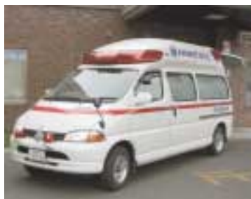
高規格救急自動車