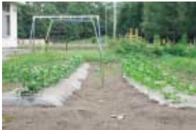
8月31日計根別児童館菜園