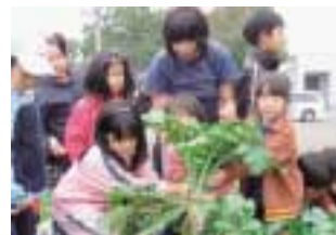
10月10日東児童館菜園の収穫