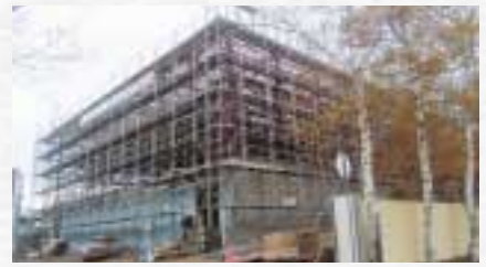
増改築整備が進められている中標津東小学校

財政公表は、町民の皆さんに納めていただいた町税等がどのように使われているかなどを、年2回（上半期、決算）お知らせするものです。今回は、平成19年度上半期（9月末）における予算執行状況についてお知らせします。