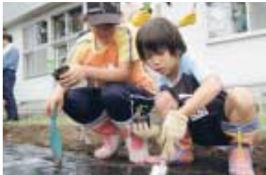
7月31日計根別児童館植付け

このことがきっかけとなり、土を耕し、ものを育てることを通して、児童と地域住民とのふれあい交流を深めていくことを目的に、5箇所の児童館で菜園づくりがスタートしました。児童館児童と町内会の方々に組織する『たがやし隊』を中心に8月から苗の植え込み、手入れをしてきました。9月中旬から写真のような立派な野菜ができ始め、10月に各児童館で収穫祭を行いました。今回は、その出来栄を紹介いたします。