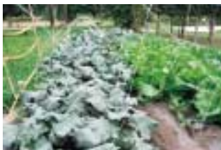
わんぱく児童館菜園