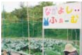
なかよし児童館菜園