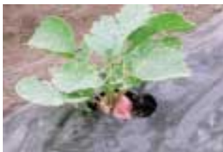
西児童館菜園のラディッシュ