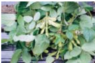
こんなに枝豆が実りました

来年の『じどうかん祭り』では、菜園で収穫した野菜を使ったメニューで、屋台村が賑うといいなと思っています。