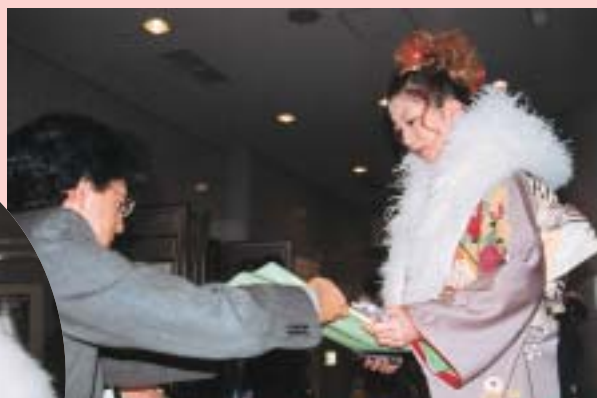
受付を済ませ成人式会場へ