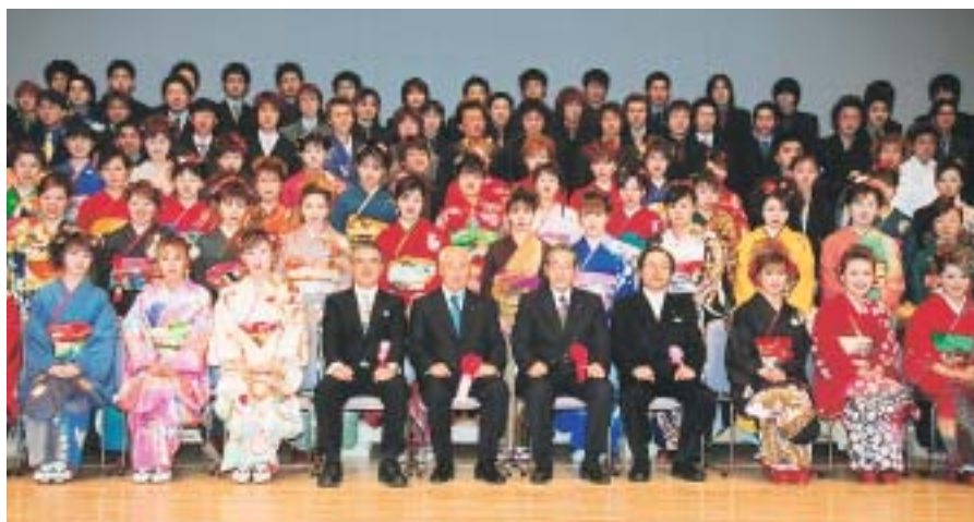
227人は2班に別れて記念撮影

するべつとの大ホールで、振り袖姿やスーツに身を包んだ二七人の新成人が出席して成人式が開催されました。会場では友達との再開を喜ぶ笑顔が溢れ、互いの近況を伝える会話が弾んでいました。