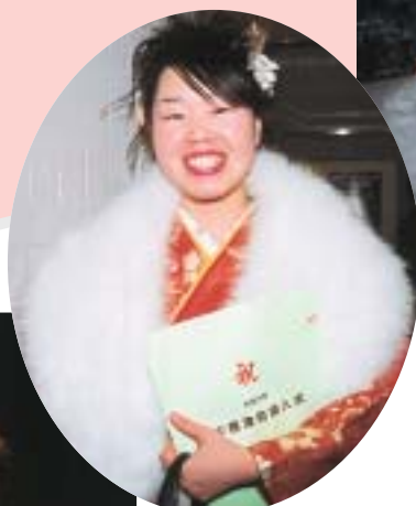
こぼれるような笑顔