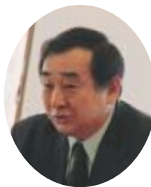
中標津連合町内会長

場 所 / 総合文化会館しるべつと広場 主 催 / 第27回なかしべつ冬まつり実行委員会 お問い合わせ 役場経済振興課観光振興係 ☎ 3 - 3 1 1 1