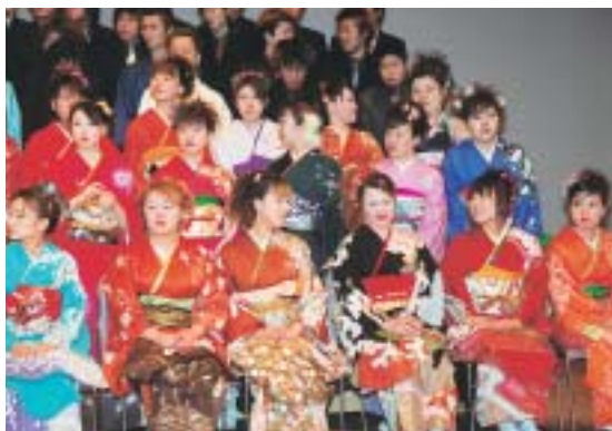
記念撮影の合間の笑顔