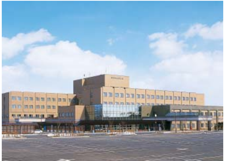
町民の健康を守る町立中標津病院