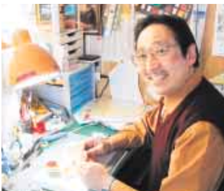
この机から発明品は生まれます

「大人ばかりでなく、発明は子どもたちにも夢を与えてくれます。以前町の子どもたちによる発明工夫展を見ましたが、どの作品も発想が豊かで楽しかった。大人には無い発想ばかりなんです。自分で考えた事を形にする作業は、大人になっても大切な事です。ぜひ、これからもたくさんさんの作品を作り続けてほしいですね。大発明家の誕生が今から楽しみですよ。」