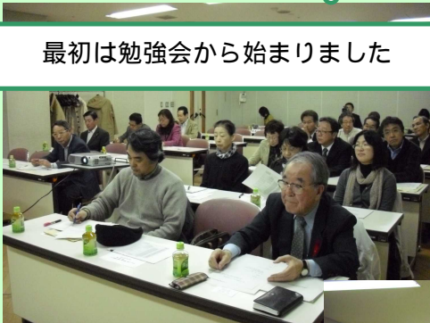
最初は勉強会から始まりました