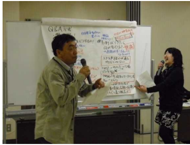
制定イベント実行委員会による説明