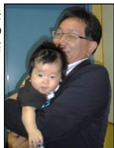
〈中標津中学校の様子〉