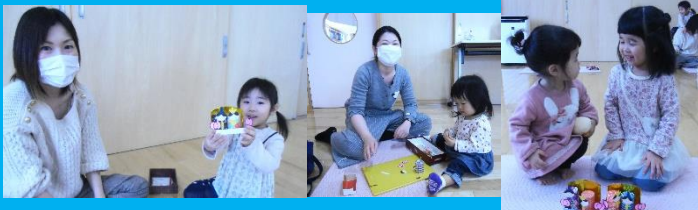
※前回の簡単工作の様子です。