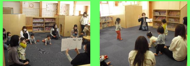
※3月「絵本タイム」の様子です。

注) コロナの感染拡大状況により、行事を中止させていただくことがあります。ご了承ください。