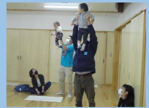
※「パパのひろば」の様子

みらいるに申し込みをして下さい。電話でもOKです。(町内の方のみとさせていただきます)