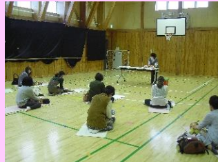
※前回の「絵本タイム」の様子