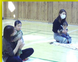
前回の「絵本タイム」の様子です