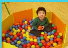
前回のボールプール とお絵描きの様子です