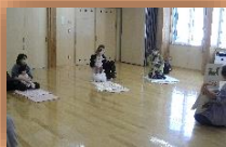
前回の絵本タイムの様子