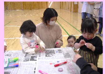
前回、袋のこいのぼりを作ってあそんだ時の様子です