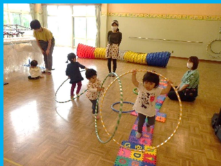
前回のうんどうあそびの様子です

日にち：8月23日(水) 時間：10時30分～ 場所：西児童館 西9条北7丁目 ☎72-3039 ×切：8月22日(火)