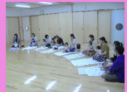
前回の絵本タイムの様子です

みらいる、または児童館に申し込みをして下さい。電話でもOKです。(町内の方のみとさせていただきます)