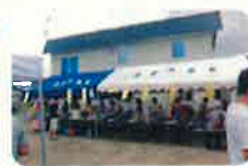
町内ふれあい祭り