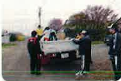
子供会による廃品回収