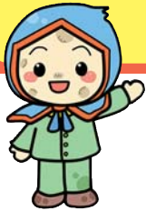
じゃがいもずきん 「ききぼう」くん