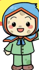
じゃがいもずきん「ききぼう」くん