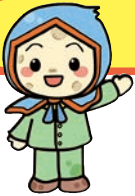
じゃがいもずきん 「ききぼう」くん

今年も本格的に雪が降る季節になりましたが、雪が引き起こす特徴的な障害のひとつに視程障害（吹雪により視界が悪くなる等）があります。視程障害は、路面や路肩の雪の量、風の強さや車の通行など、様々な原因によって発生することがあります。『視程障害は雪が降っている時にしか起こらない』とは考えず、常に安全運転を心がけましょう。