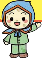
じゃがいもずきん「ききぼう」くん