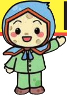
じゃがいもずきん「ききぼう」くん