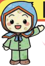
じゃがいもずきん「ききぼう」くん