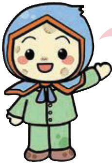
じゃがいもずきん 「ききぼう」くん

みなさんは、「自助・共助・公助」という言葉を聞いた事がありますか？ 自助 は自分で自分を助けること、 共助 は家族や企業・地域コミュニティで共に助けあうこと、そして、 公助 は行政による救助や支援のことです。