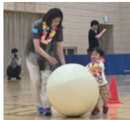
子育てサークル運動会のようす

ため、継続して子育て世代包括支援センター事業に取り組んでいます。 ※子育て世代包括支援センター事業 妊産婦および乳幼児の健康の保持・増進に関する包括的な支援を行うことにより、妊娠前から切れ目のない支援を提供する体制を構築します。 中標津町では、保健センターと児童センター「みらいる」で事業を実施しています。また、生後4か月までの赤ちゃんのいる家庭を児童センターの職員が訪問する「こんにちは赤ちゃん訪問事業」を継続して実施し、令和7年度は120件（▲1件）の家庭を訪問しました。