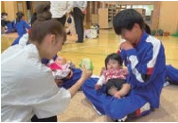
赤ちゃん交流のようす

町内の中学3年生を対象に「命の重み」を伝えることを目的とする「赤ちゃんふれあい交流事業」を継続して実施しています。