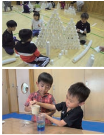
じどうかんのようす

放課後児童クラブは、小学1～3年生を対象に各児童館・児童センターでの受け入れを実施しています。令和7年度は276人(▲4人)の登録がありました。また、高学年児童の居場所を確保するため、児童館の利用時間を最大18時としています。