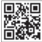
ウェブサイトはこちらから

道東の3つの国立公園(釧路湿原、阿寒摩周、知床)とまちをつなぐ歩く旅の道「北海道東トレイル」の2026年シーズンが始まりました。 最新情報はウェブサイトおおよびSNSをご覧ください。