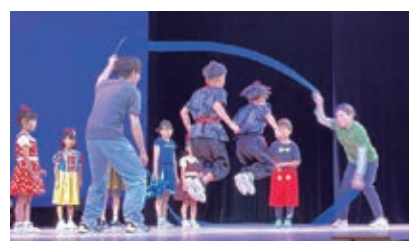
じどうかん祭りのようす

子どもたちの豊かな人間性と創造性を育むことを目的に、地域の方々が趣味・特技を通して技術を伝える「チャイルドアドバイザー事業」のほかに、児童館菜園「たがやし隊」事業など、地域の方々とも子どもたちの顔が見える関係づくりをめざし実施しています。