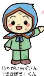
じゃがいもずきん 「ききぼう」くん

令和6年1月1日に発生した能登半島地震でも被害拡大の一因と指摘されているのが木造住宅の低い耐震化率とされています。