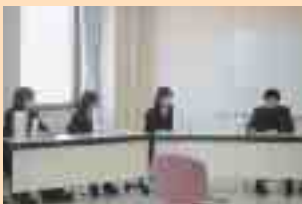
子育て世代間交流会