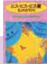
『ビス・ビス・ビス星ものがたり』