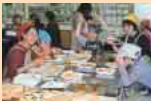
楽しく作ろう会(料理教室)