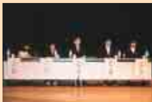
アンダーセブンティーンVS社会人選抜

高校生から70代までの実行委員会が主管する青少年の「いのち」を守る住民大会が3月16日にしるべつとで開催されました。当日は、350人が集まり高校生を交えたパネラーと会場の参加者が討論会で積極的に発言するなど、白熱した論議が交わされました。