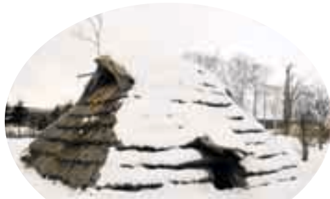
中標津町ポー川史跡自然公園内にある竪穴住居です

内容 竪穴住居づくり （穴掘り、笹刈り、上屋づくり、屋根ふきなど） 期間 5月から9月くらいまで （第2・第4土曜日ほか毎月2回程度を予定） 対象 高校生から大人まで 人数に制限はありません 申込方法 4月22日（月）までに、お電話でお申し込みください。 費用 無料 主催 町づくり支援団体P.D.S（プラン・ドゥ・シー） 共催 あすなる会 中標津町教育委員会