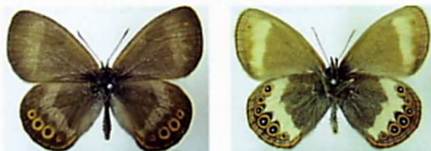
シロオビヒメヒカゲ