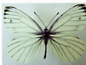
エソスジグロシロチョウ