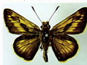
コキマダラセセリ