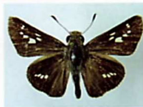
イチモンジセセリ