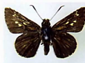
コチャバネセセリ