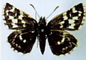
チャマダラセセリ