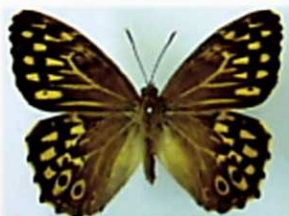
サトキマダラヒカゲ