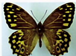
ヤマキマダラヒカゲ