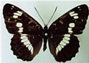
イチモンジチョウ