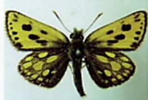
カラフトタカネキマダラセセリ