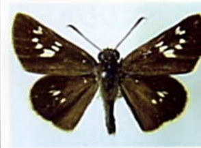
オオチャバネセセリ