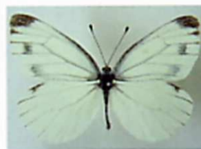
スジグロシロチョウ