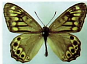
ヒメキマダラヒカゲ