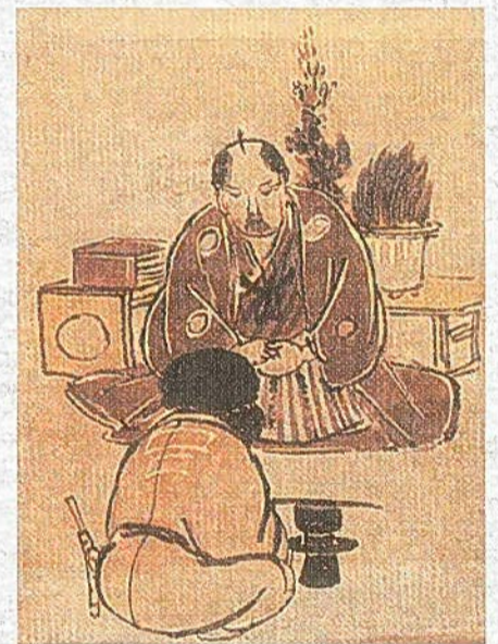
【図3】『自画自賛』加賀伝蔵 画 別海町郷土資料館付属施設加賀家文書館蔵