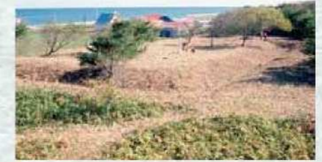
ホニコイチャシ跡(陣屋推定地)

松浦武四郎の『知床日誌』[安政5(1858)年]の記録には、「ホニコイ番屋追分有、左舎利(斜里)山道右十三丁の方シベツ」とあり、ホニコイは斜里と標津を結ぶ位置にあったとしています。