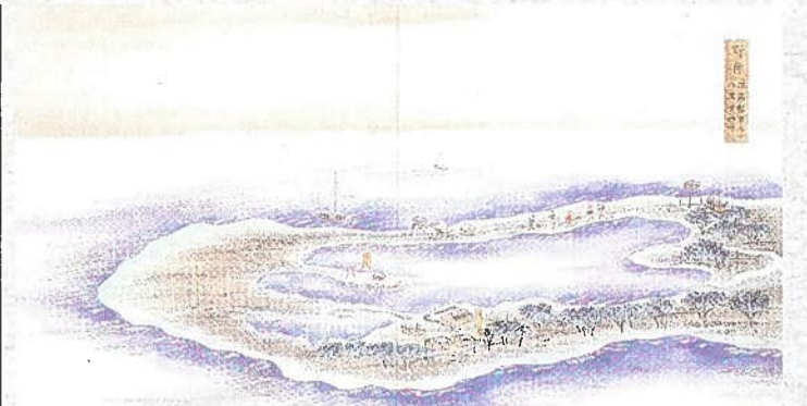
【図1】『北海道歴検図 根室州 上』「野付之図」 目賀田帯刀 安政4(1857)年 北海道大学付属図書館蔵