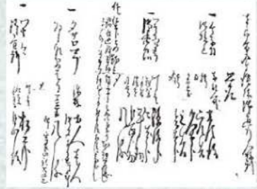
「箱館奉行所モンベツ諸書付伝蔵宛封書」

会津藩士が現地受け取りのため斜里山道を通行した際に、道中の休憩所や宿泊所での標津会所側の対応を、箱館奉行所の役人が記述した文書『箱館奉行所モンベツ諸書付伝蔵宛封書』[安政七(1870)年]が残されており、それぞれの係が出向いてもなしていた様子を知ることができます。