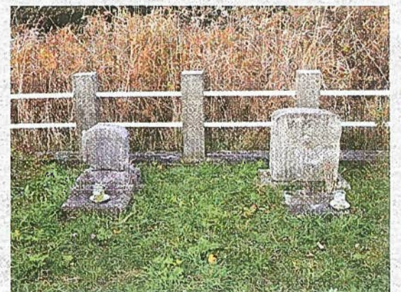
【図4】会津藩士の墓(標津町指定文化財)