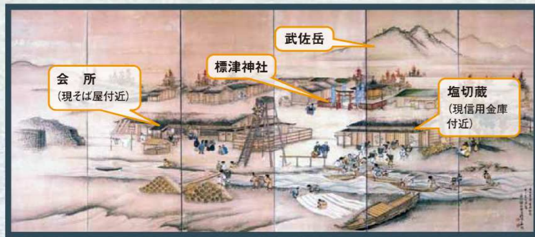
標津番屋屏風(新潟県西巖寺所蔵)