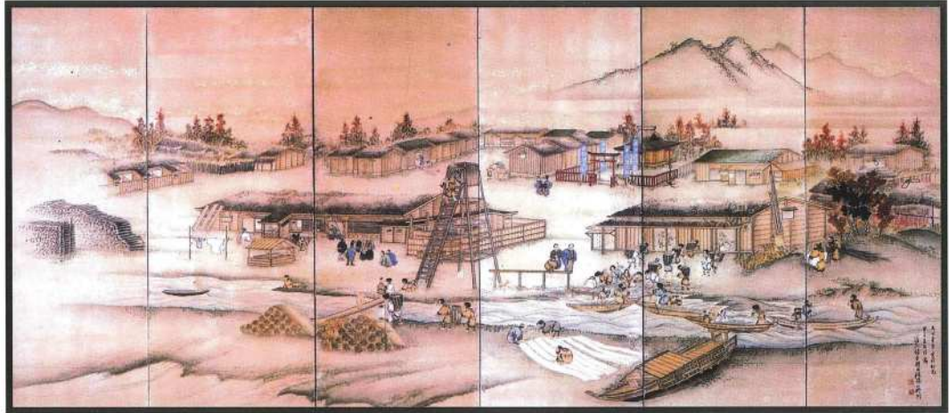
『標津番屋屏風』(新潟県西蔵寺所蔵)

発行:平成25年11月30日 発行所:中標津町教育委員会 標津郡中標津町丸山2丁目22番地 電話:教育委員会(0153-73-3111) 郷土館(0153-72-2190) http://www.nakashibetsu.jp/kyoudokan_web/index.htm